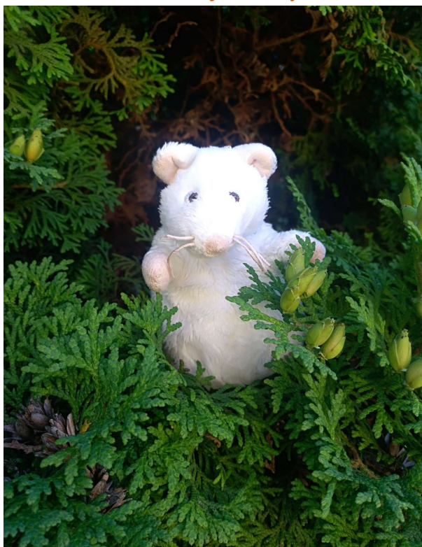
Krysa z lesa