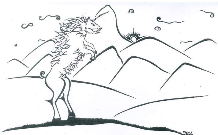
Podle volného vyprávění Žeryka, hraničářova psa