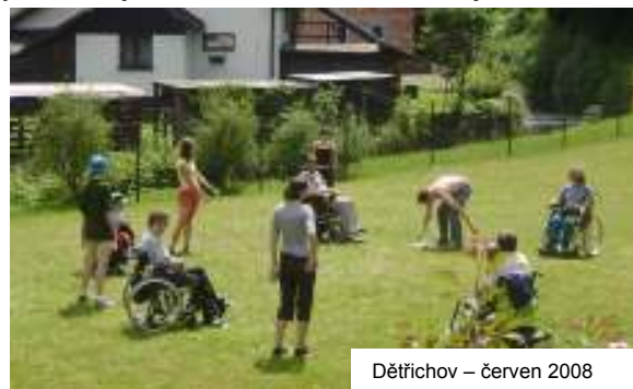
Dětrichov – červen 2008