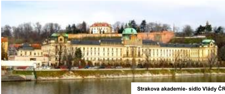
Strakova akademie- sídlo Vlády ČR