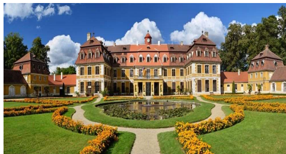
Jen pro cestovatelé - Zámek Rájec nad Svitavou

Kdy: čtvrtek 20. 7. 2023 odjezd 9:00h parkoviště Billa (Jeremiášova 1, Olomouc) návrat cca 15:30h na stejné místo