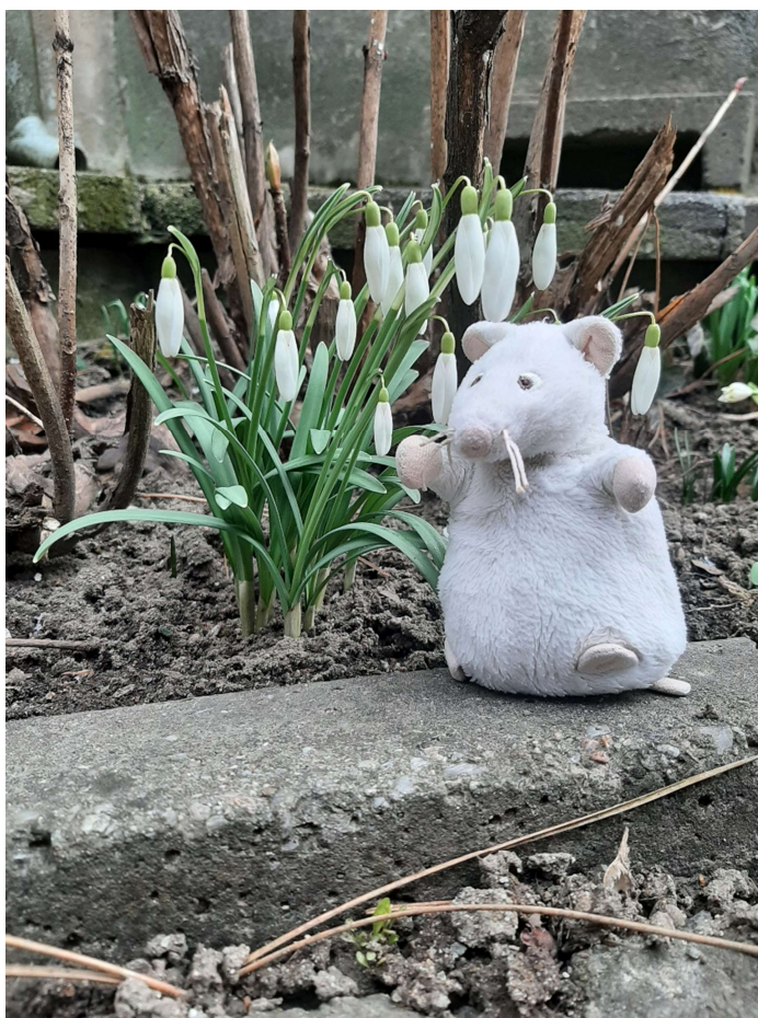
Nasněžíno trochu jinak